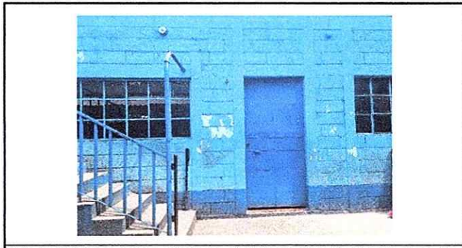
Foto 6: Pintura de muros exteriores e interiores y sustitucion de chapa de puerta

Observación: Si es necesario se pueden agregar hojas adicionales y actualizar el número de hojas.