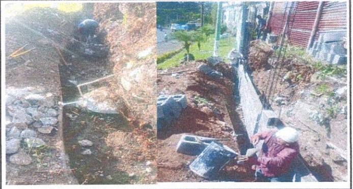
Foto 4: 15.1 Reparación de muro perimetral de block. Esta foto muestra el proceso de construcción de pared, desde el zanjeo para el cimiento.