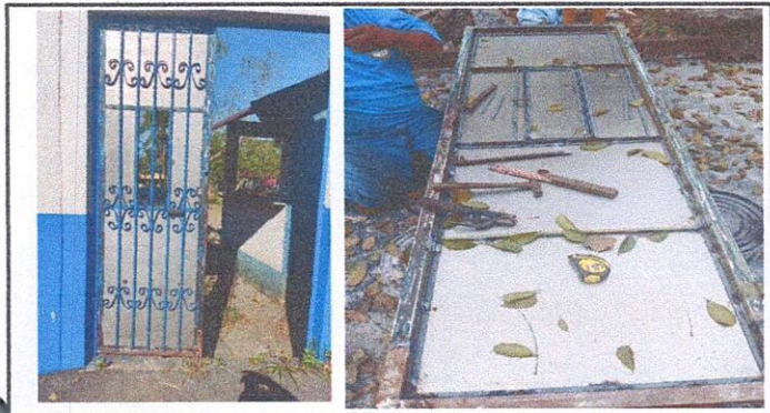
Foto1: 4.1 Mantenimiento a estructura(lijado,cambio de tubo,cepillado, sujeciones, aplicación de pintura) Para realizar la reparación fue necesario desmontar la puerta.