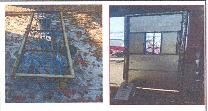
Foto 2: 4.2 Sustitución de chapa. Proceso para el cambio de chapa.