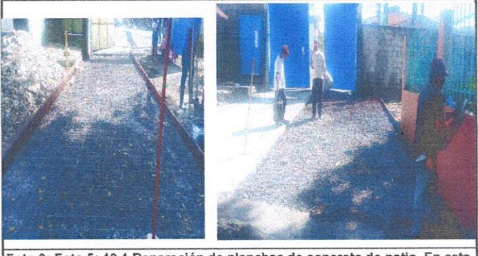
Foto 6: Foto 5: 16.1 Reparación de planchas de concreto de patio. En esta foto Colocando electromalla para luego aplicar el concreto

Observación: Si es necesario se pueden agregar hojas adicionales en el Anexo 1 y 2.