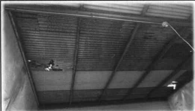
Foto 9: Estado actual de láminas y estructura de soporte en la Escuela Oficial Urbama Mixta.