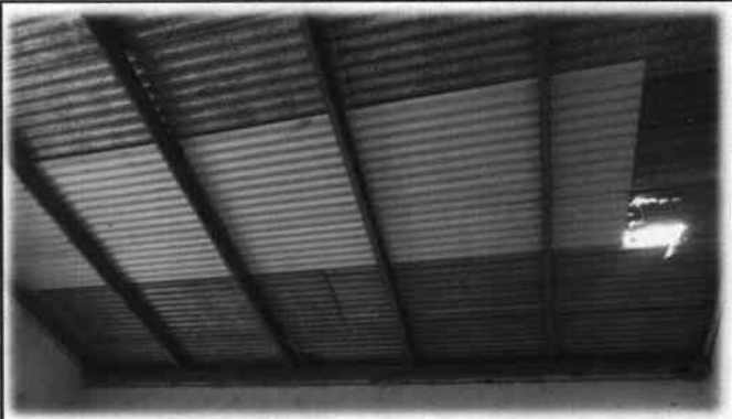
Foto 8: Estado actual de láminas y estructura de soporte en la Escuela Oficial Urbama Mixta.