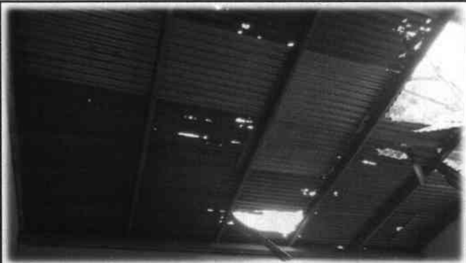
Foto7: Es necesario el suministro e instalación de lámina troquelada Aluzinc calibre 26 (incluye tornillos).