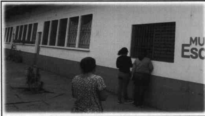
Foto 11: Proceso de registro de necesidades prioritarias durante la evaluación de campo.