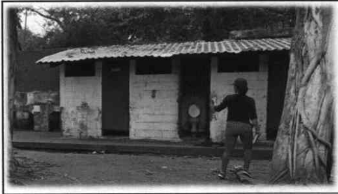
Foto 12: Proceso de registro de necesidades prioritarias durante la evaluación de campo.