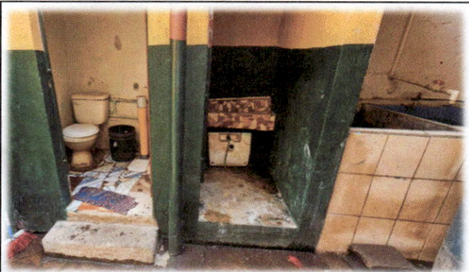
Foto 3: Mejoramiento en el 1er módulo de servicios sanitarios por medio del cambio e instalación de inodoros, incluye conexión y kit completo.