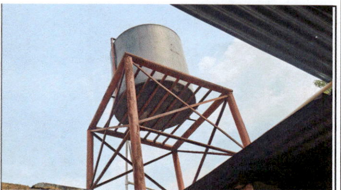
Foto 6: Es necesario el cambio e instalación de deposito de agua 1250 lts incluye accesorios y conexiones.