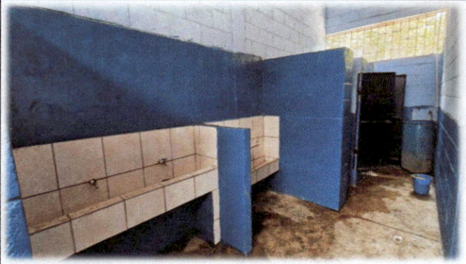
Foto 7: Mejoramiento de servicio sanitario, incluye reparación, cambio de tubería y artefactos, cambio e instalación de azulejos y cambio e instalación de piso antideslizante.