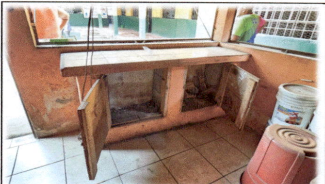
Foto 10: Mejoramiento y reparación de cocina, incluye muebles de cocina fijos de concreto y azulejo.