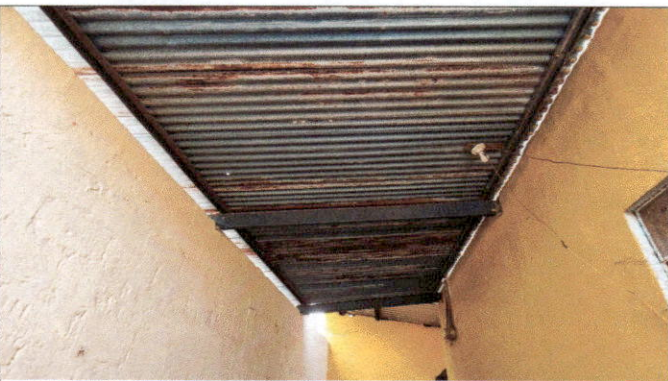
Foto 5: En el área de lavamanos, es necesario dar mantenimiento a la estructura de soporte y el cambio e instalación de lámina, por lámina troquelada aluzinc calibre 26 (incluye tornillos)