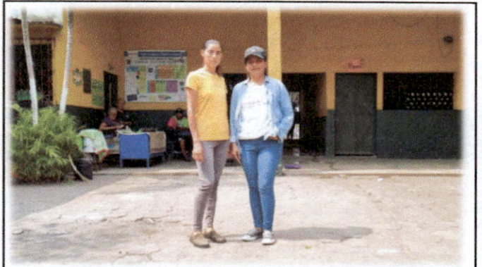
Foto 2: Presidente de la OPF y Evaluadora de Campo, realizando la visita técnica para identificar las necesidades con mayor prioridad.