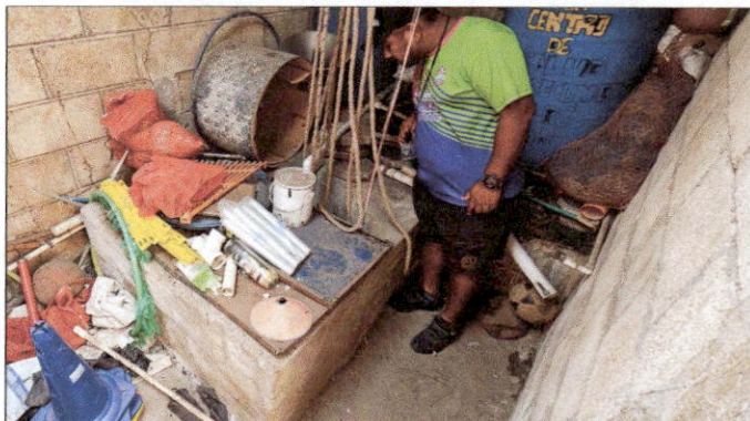
Foto 11: Se detecta la necesidad de darle mantenimiento al pozo así como el cambio e instalación de bomba sumergible 1hp incluye accesorios y conexión de tubería.