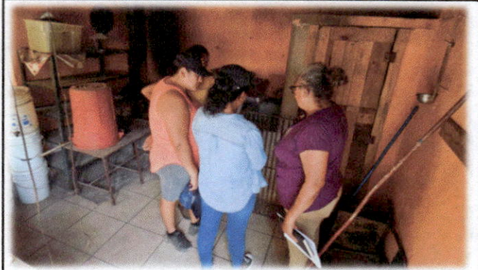
Foto 8: Directora, padres de familia y Evaluadora de Campo durante la visita de campo identificando las necesidades prioritarias.