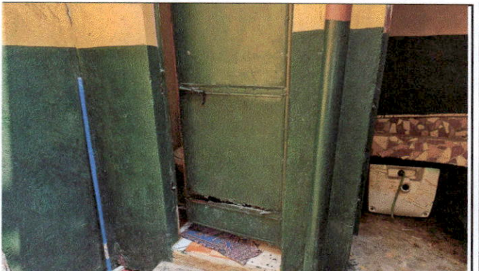
Foto 4: Existe la necesidad de la reparación y mantenimiento de las puertas.