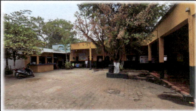
Foto1: Escuela Oficial Rural Mixta, colonia Los Portales.