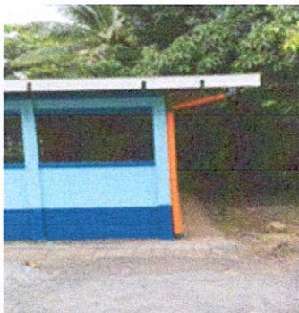
Foto 3: Sustitución de bajada de agua pluvial de metal por tubo PVC 3"