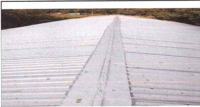
Foto 1: Evidencia de la finalización del cambio de techo de los primeros 3 salones, dirección, cocina, y baños de niños y niñas.