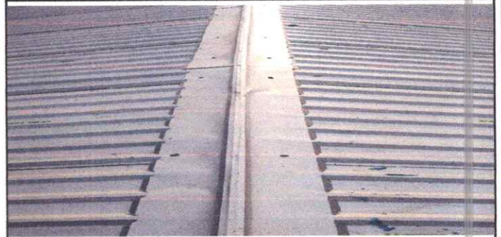
Foto 2: Evidencia de la finalización de la sustitución de capote, en los salones, dirección y baños.