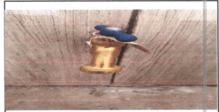
Foto 6: Evidencia de la finalización de la sustitución de 8 chorros de los baños de niñas de niñas.

Observación: Si es necesario se pueden agregar hojas adicionales y actualizar el número de hojas.