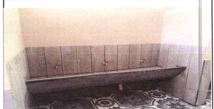
Foto 4: Evidencia de la finalización de la sustitución de azulejo en baños de niñas y niños.