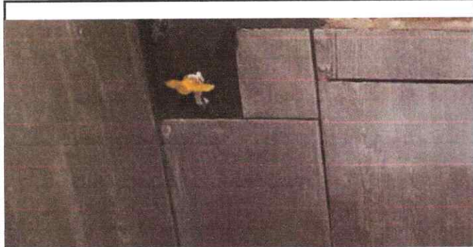
Foto 3: Evidencia de la finalización de la sustitución de llave de paso de los baños.