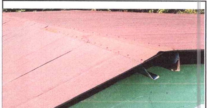
Foto 2: Sustitución de capote, en los salones, dirección y baños.