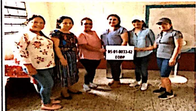
Foto 10: Grupo de la escuela con codigo 05-01-0033-42 se le entrego el rotulo de identificación.