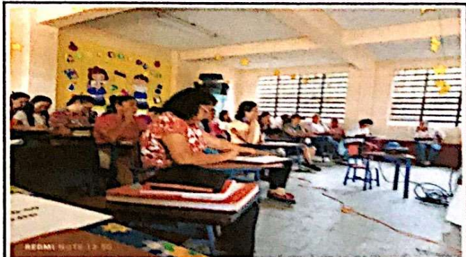
Foto 6: Evaluadora de campo sigue impartiendo capacitacion de aspectos tecnicos.