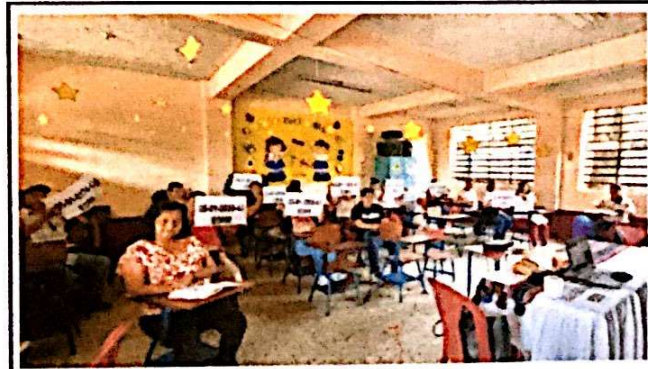
Foto 12: Se finaliza la capacitación. Y se agradece al grupo presente.