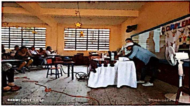
Foto1: Se instala el equipo para brindar la capacitación al grupo presente del distrito de Escuintla, Escuintla área Rural.