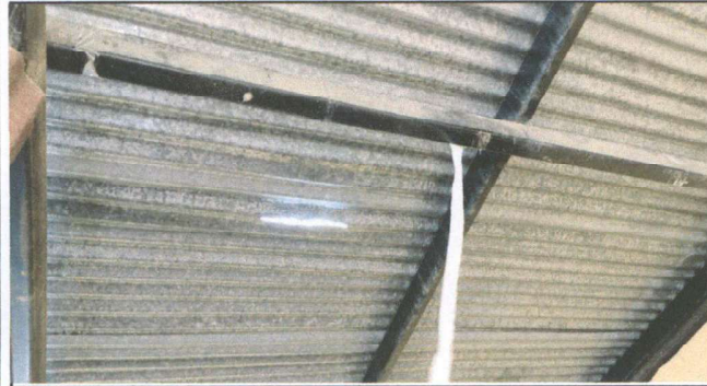
Foto1: Cubierta de Lámina