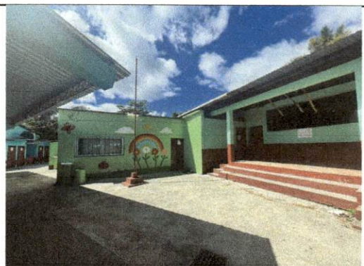
Foto 6: Módulo B, patio donde se realizan actividades y se necesita continuar con el techo de lámina

CONSEJO DE PADRES DE FAMILIA ALDEA EL ROSARIO CHIQUIMULA, GUATEMALA