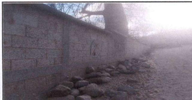
Foto 5: Vista por fuera, lado de la carretera, está inclinado hacia adentro.