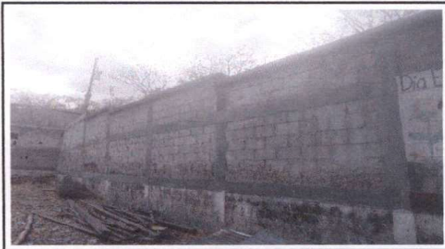
Foto 2: Muro perimetral parte de adentro del establecimiento, inclinado hacia el patio de la misma, peligro para alumnos.