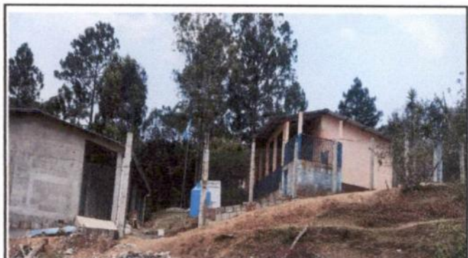
Reparación de muro perimetral.