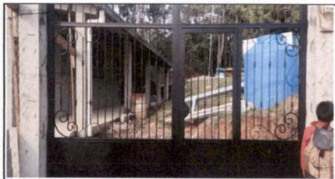
Sustitución de portón de entrada de la escuela.