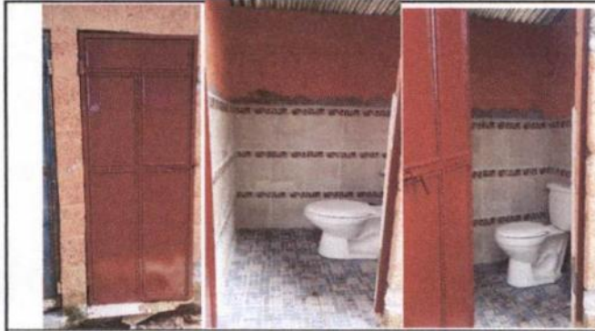
Lijado, sustitución de tubo y pintrua de las puertas de los baños