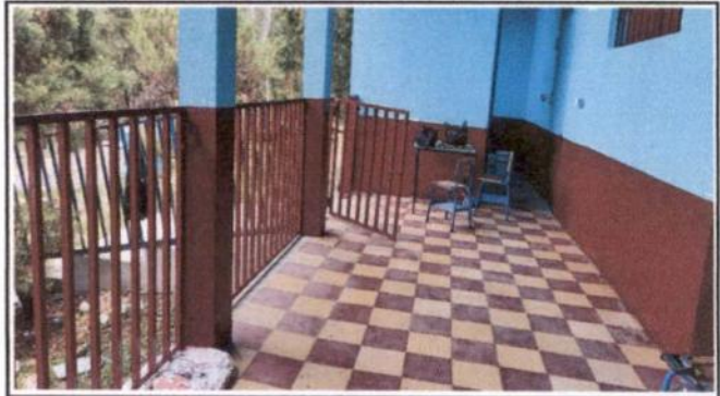
Pintura de muros interiores y exteriores