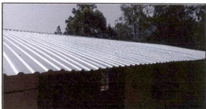
Sustitución de cubierta de lámina por lámina troquelada y sustitución de estructura de soporte de madera por estructura de metal.

Observación: Si es necesario se pueden agregar hojas adicionales y actualizar el número de hojas.