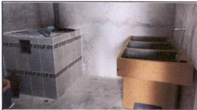
Sustitución de pila y remodelación de cocina.