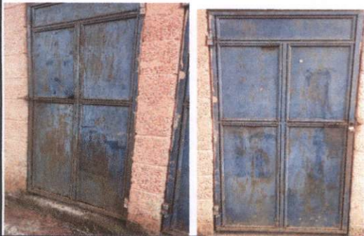
Lijado, sustitución de tubo y pintrua de las puertas de los baños