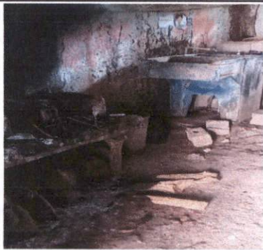
sustitución de pila de la cocina debido a su deterioro.