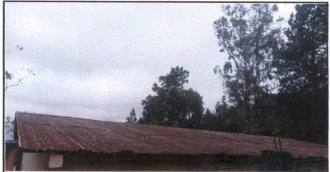
Sustitución de cubierta de lámina por lámina troquelada y sustitución de estructura de soporte de madera por estructura de metal.

Observación: Si es necesario se pueden agregar hojas adicionales y actualizar el número de hojas.