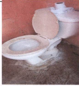
Sustitución de sanitarios debido a que estan en mal estado, pues tienen fuga de agua.