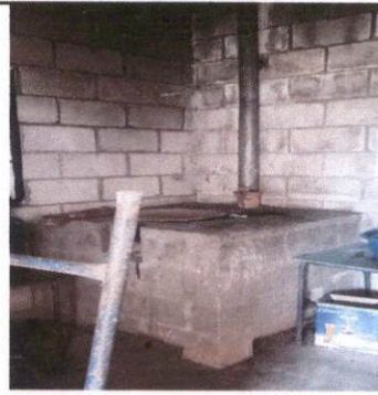
Repello y pintado de cocina