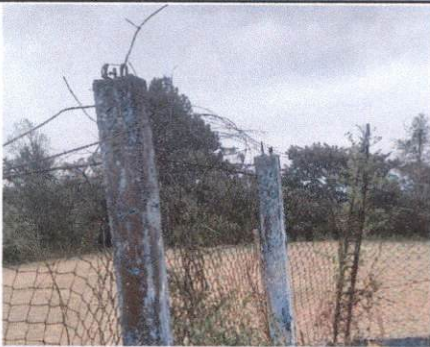
Sustitución de maya al muro perimetral