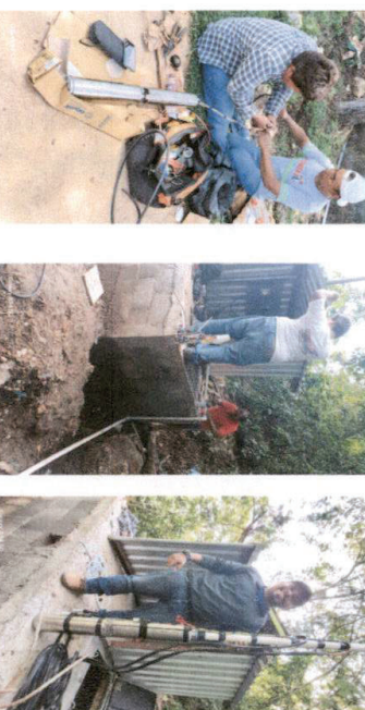
Foto 8 En proceso de Sustitución de bomba de agua sumergible, previo a la instalación y realizar la prueba.