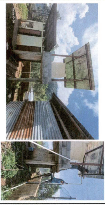
Foto 2: Construcción de la terraza para colocar tinaco finalizado en su 100%.