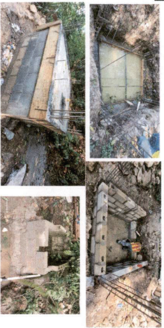
Foto 7 En proceso de construcción de tanque de 2x2 m2. Y mejoramiento del tanque de captación.