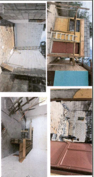
Foto 9 En proceso de ampliación de cocina de 3x3 m2. construcción de hornilla.

Observación: Si es necesario se pueden agregar hojas adicionales y actualizar el número de hojas.