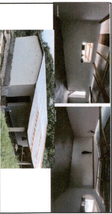
Foto 6: Repello de aula de adobe adentro y afuera, construcción de pretil de block realizado en su 100%.

Observación: Si es necesario se pueden agregar hojas adicionales y actualizar el número de hojas.