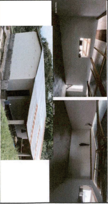
Foto 6: Repello de aula de adobe adentro y afuera, construcción de pretil de block realizado en su 100%.

Observación: Si es necesario se pueden agregar hojas adicionales y se anexará al siguiente de hojas.