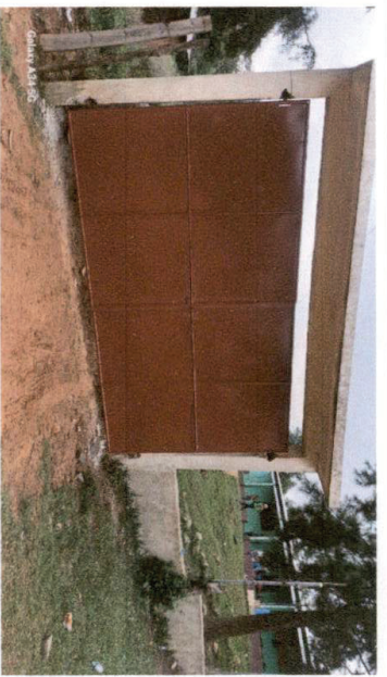
Foto 4: Instalación del portón de estructura metálica en su 100%.