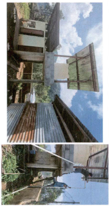
Foto 2: Construcción de la terraza para colocar tinaco finalizado en su 100%.