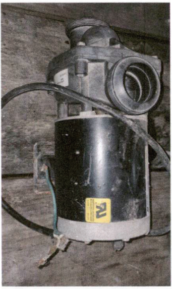
Foto 8 Sustitución de bomba de agua.