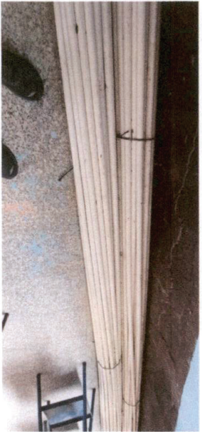
Foto 3: Sustituir la red de tubería de 3/4 por la potencia de la bomba se necesita de 1 1/2 para 350 metros de distancia.