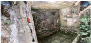
Foto 7 Ampliación del Tanque del pozo de donde se instalará la bomba.