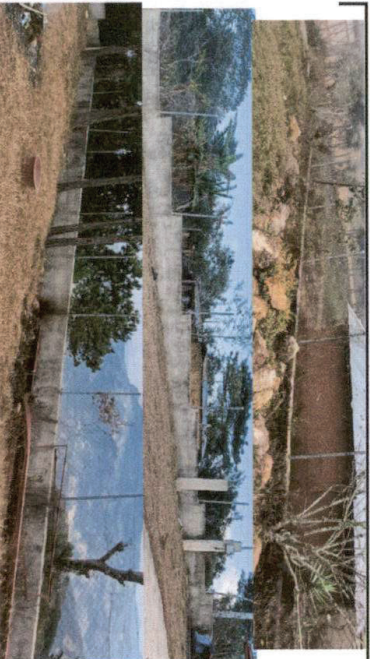
FOTO 1 Subir 7 hiliadas de block, reforzar con columnas y soporte las hiliadas de block, corresponde a 41 m lardo por lado, 1,50 cm de alto, haciendo un total de 241 m2