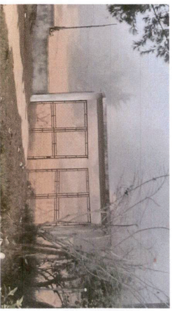
Foto 4: Sustituir el porton de malla, por uno de estructura metálica.