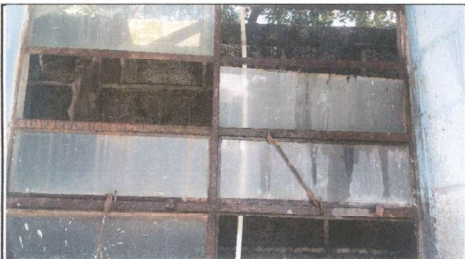
Foto 3: Mantenimiento a estructura de metal de ventana y sustitución de vidrios