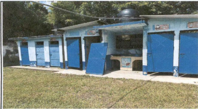
Foto1: Mantenimiento a estructura de puertas