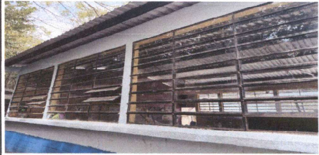
Foto 8: Sustitución de ventanas de vidrios por ventanas corredizas.