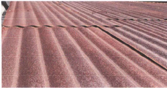
Foto1: Techo dañado de aula.