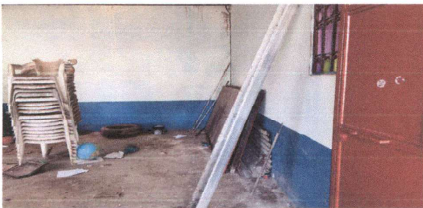
Foto 3: Reparación de grieta de pared, pintura, colocación de piso y sustitución de ventanas.