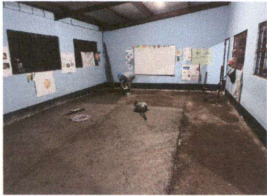
Foto1: Instalación de piso cerámico