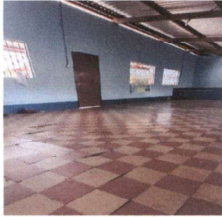
Foto1: Instalación de piso cerámico