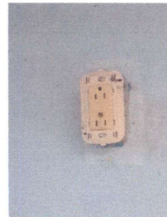
Ins Foto 6: Reparación del sistema eléctrico

Observación: Si es necesario se pueden agregar hojas adicionales y actualizar el número de hojas.