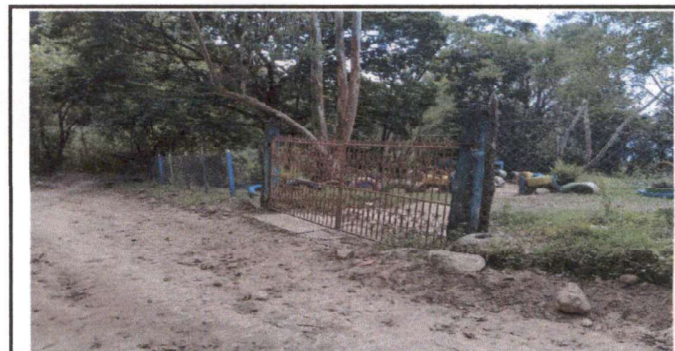
Foto 6: Cambio de serca por tubo cuadrado galvanizado y malla galvanizada

Observación: Si es necesario se pueden agregar hojas adicionales y actualizar el número de hojas.