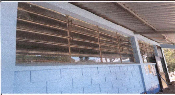
Foto 9: Fabricación e instalación de ventanas por ventanas de pvc