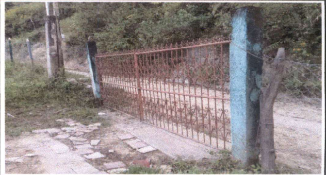
Foto 8: Reparación de columnas y fundición de plancha de concreto entrada