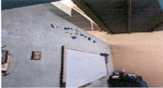
Foto No 1. techo de aula humeda