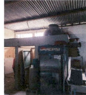
Foto No.2. area de baños en malas condiciones y areas de cocina redicidas.