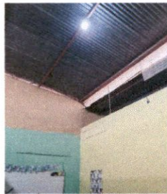
Foto 5: desprendimiento de lamina por las fuertes lluvias y altas en goteras