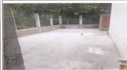
patio de cemento