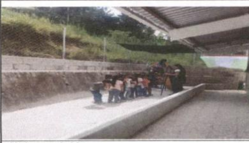
caída de aguas pluviales