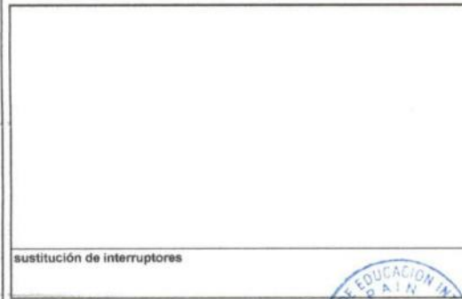
sustitución de interruptores