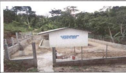
muro perimetral block