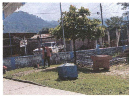
Foto 2: Padre de familia organizando material para trabajar en reparación de malla galvanizada