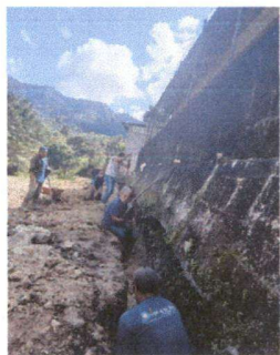
Foto1: Los padres de familia trabajando en muro de contención