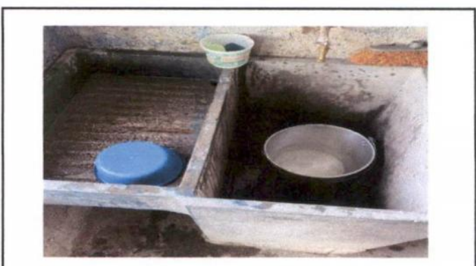
Reparación y mantenimiento de cisternas / depósitos de agua potable

Observación: Si es necesario se pueden agregar hojas adicionales y actualizar el número de hojas.