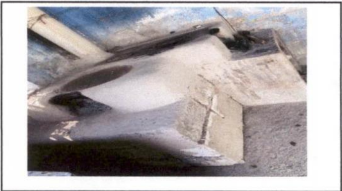
Reparación o sustitución del área de Cocina