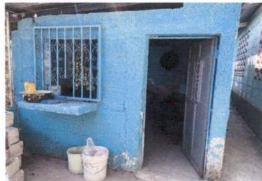
Sustitución de estructura de metal de ventana