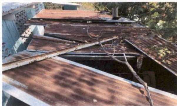
Sustitución de lámina, por lámina troquelada