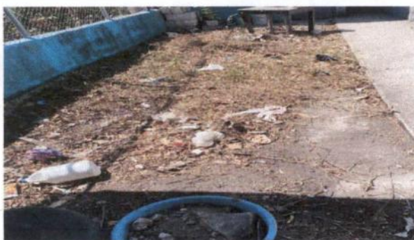
Sustitución de piso de torta de concreto