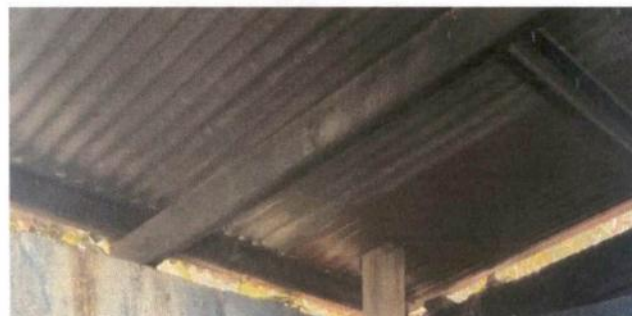
Sustitución de estructura de soporte (madera, metal) por metal