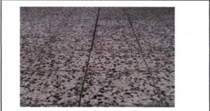
Sustitución de piso de granito