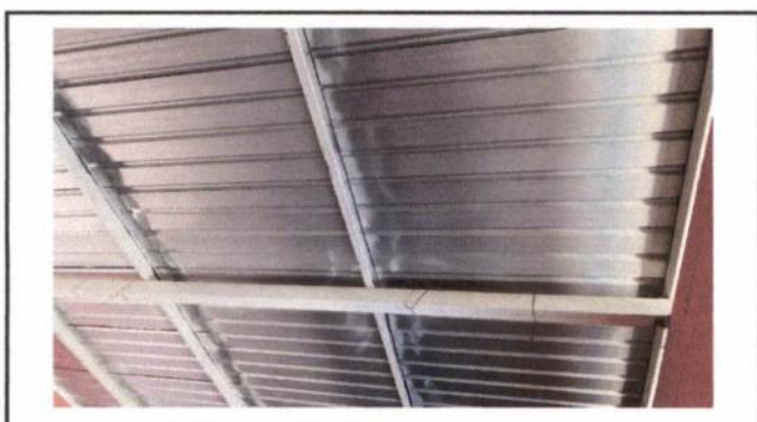
Reparación de cableado eléctrico