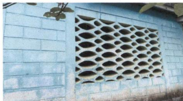
Pintura en muros exteriores e interiores

Observación: Si es necesario se pueden agregar hojas adicionales y actualizar el número de hojas.