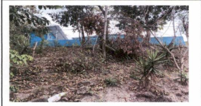
Reparación de muro perimetral de block