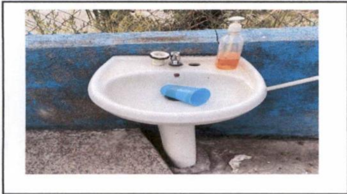
Sustitución de lavamanos