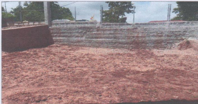
Foto 5: resultado final del muro perimetral, cercanias del porton principal