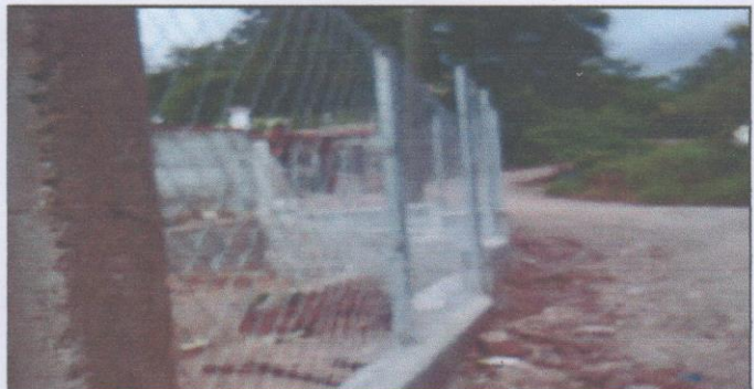
Foto 6: Resultado final de la colocacion de malla galvanizada lado exterior.