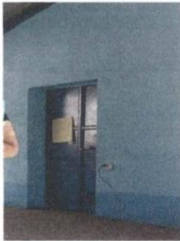
Foto 9: Mantenimiento a portones ( se les cortó la parte de abajo para que coincidieran al momento de colocar el piso.)