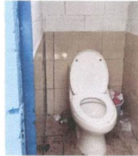
Foto 8: Servicios sanitarios y sus accesorios (un baño nuevo y dos se le colocaron solo los accesorios)