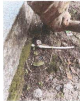
Foto 10: Reparación de drenajes y red de agua potable ( se sustituyeron llaves de pado, tubos de agua potable, accesorios de tinaco y tubería de drenajes.