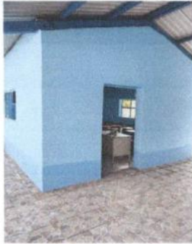
Foto 7: Pintura en muros interiores y en las aulas interior y exterior