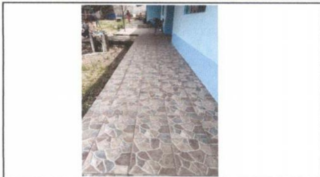
Foto 2: Piso. (Sustitución de piso rústico, por cerámica, de los corredores y cocina)