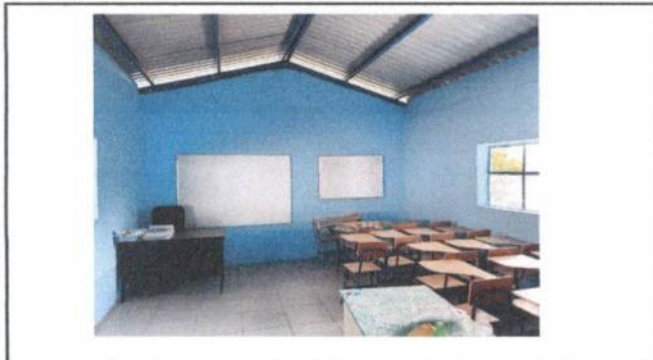
Foto 3: Piso. (Sustitución de piso líquido, por ceramica de las aulas pequeñas)