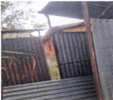
Foto 5 Baños en malas condiciones.