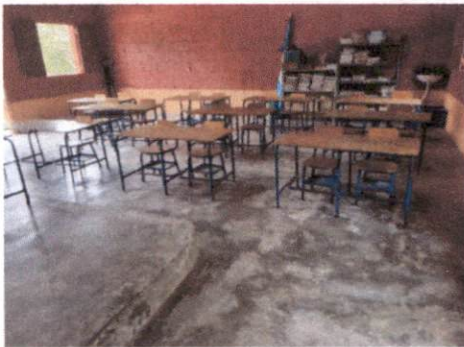
Foto 3 Piso de la escuela en malas condiciones.