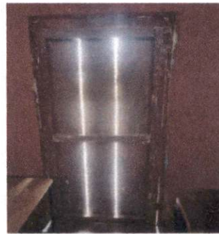
Foto 4 Puerta del salon de clase en malas condiciones.