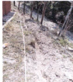
Foto 6 Muro perimetral en malas condiciones.

Observación: Si es necesario se pueden agregar hojas adicionales y actualizar el número de hojas.