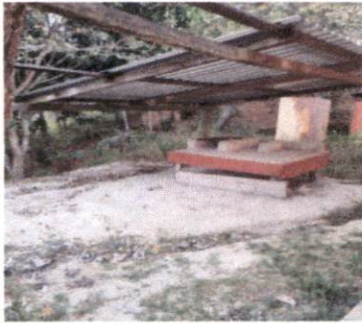
foto 1 Muro perimetral en malas condiciones