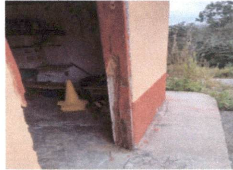
foto 2 Puertas de salon en malas condiciones.