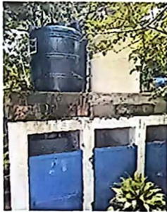
Foto 3: Tinaco y red de conexión de agua en proceso de mejora y ampliación