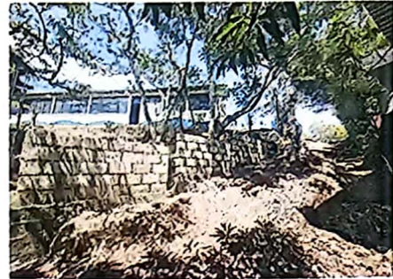
Foto 2: Muro périmetral en construcción para reducir zonas de riesgo.