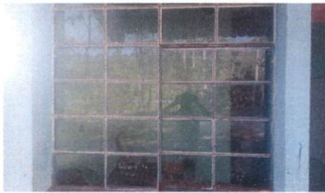
SUSTITUCIO DE VIDRIO