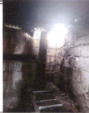
sustitución de estructura de soporte de madera por metal