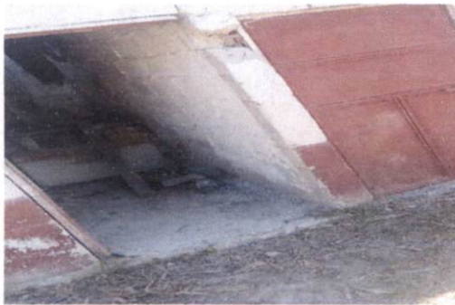
sustitución de puertas de metal cocina