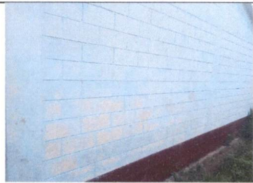
PINTURA EN MUROS EXTERIORES E INTERIORES