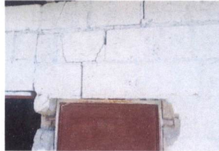
reparación de muro perimetral block