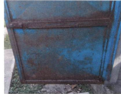
sustitución de puerta de metal baños