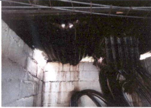
Sustitución de lámina, por lamina troquelada