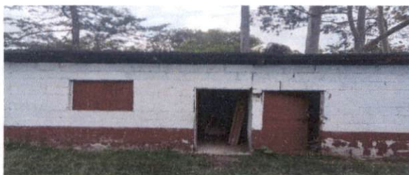
Sustitución de ventana