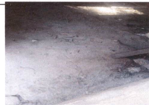
Sustitución de piso de concreto

Observación: Si es necesario se pueden agregar hojas adicionales y actualizar el número de hojas.