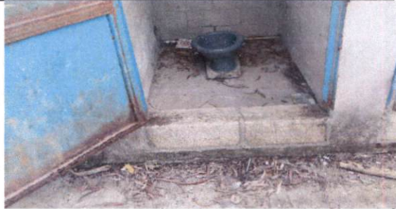
Sustitución de Inodoro