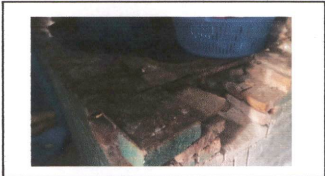
Foto2: Reparación de la hornilla del centro educativo.