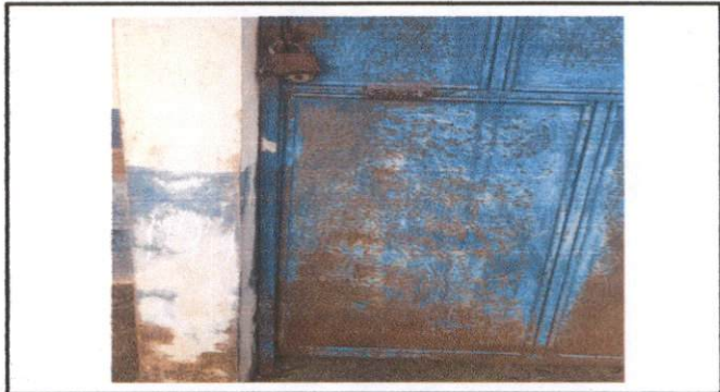
Foto 4: Cambio de chapas y pintura de puertas en área de baños y aulas.