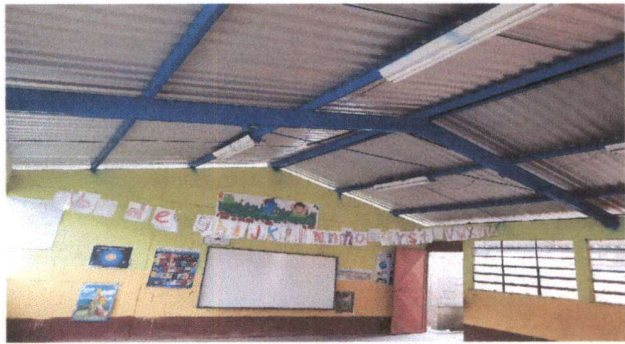
Foto1: sustitución de lamina troquelada y capotes