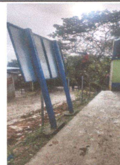
Foto 6: Sustitución de serco de alambre por tela malla y tubo galvanizado

Observación: Si es necesario se pueden agregar hojas adicionales y actualizar el número de hojas.