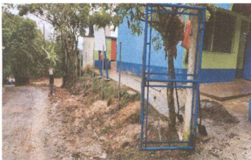
Foto 3: Sustitución de serco de alambre por malla y tubo galvanizado