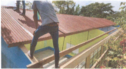
Foto1: Sustitución cubierta de lámina