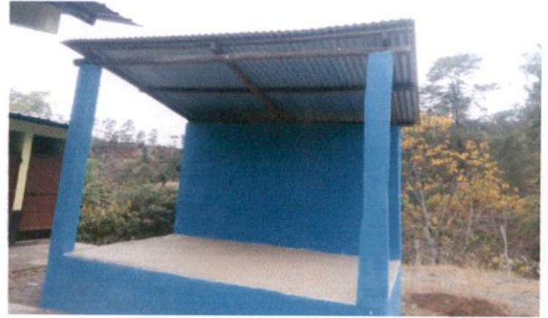
Foto 2: Sustitución de estructura de soporte de madera por metal.