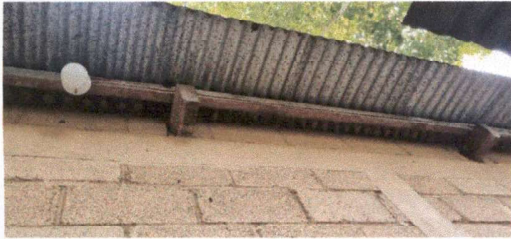
Foto1: Instalación de estructura metálica para el techo.