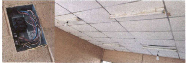
Foto 4: Mantenimiento del sistema eléctrico y sustitución de bombillas.