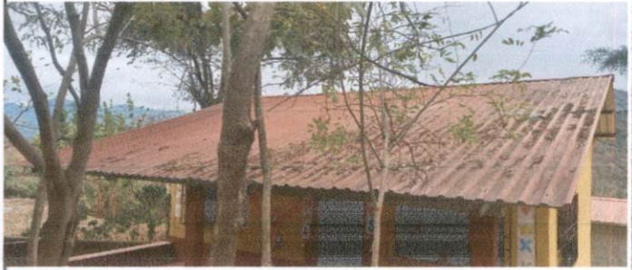
Foto 1: Cubierta de lámina, sustitución de lámina por lámina troquelada.