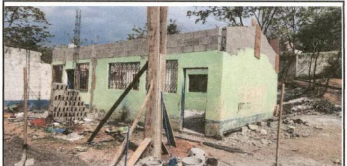
Foto 4: Agregando altura a paredes y remodelando corredor del salón de clases.