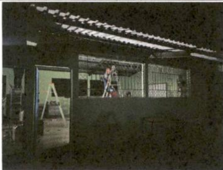
Foto 5: Reparación de cableado eléctrico y sustitución de flipónes.