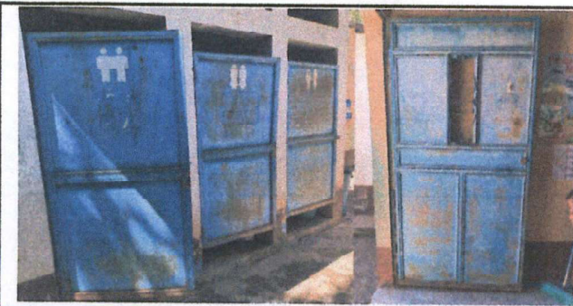
Foto 5: Mantenimiento y reformazamiento de puertas en mal estado.