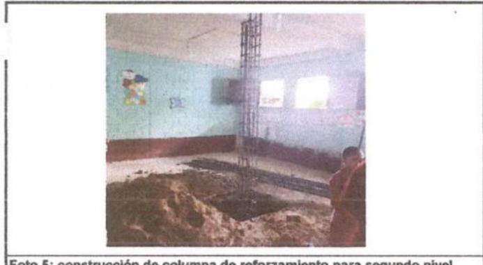
Foto 5: construcción de columna de reforzamiento para segundo nivel