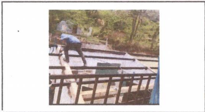
Foto 1: pintura de costanera y sustitución de lámina por lámina roquelada