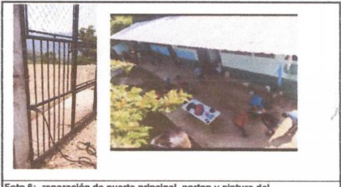
Foto 6: reparación de puerta principal, porton y pintura del establecimiento

Observación: Si es necesario se pueden agregar hojas adicionales y actualizar el número de hojas.