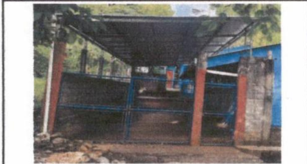
Foto 1: Ampliación de 192 m2 de lámina troquelada y estructura de metal en patio del establecimiento