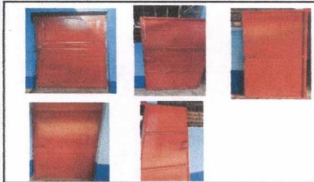
Foto 3: Mantenimiento a estructura de 5 puertas (lijado, cambio de tubo, cepillado, sujeciones, aplicación de pintura)