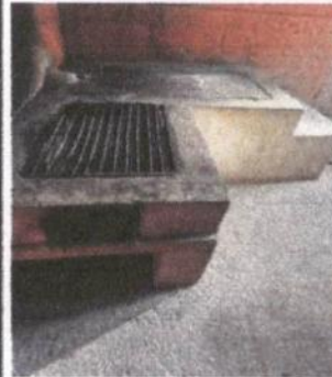
Foto 10: Reparación de estufa rural (loza de hornilla). Mantenimiento de plancha de estufa rural.