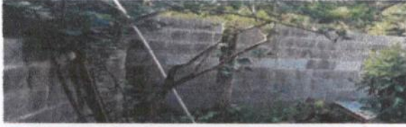
Foto 7: Sustitución de 12 M2 de muro perimetral de block, malla galvanizada, soleras intermedias y columnas