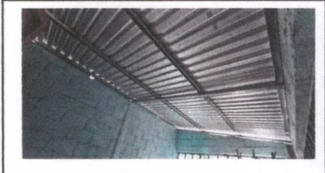
Foto 2: Sustitución de 49 M2 de lámina y estructura por lamina troquelada y estructura de metal