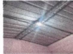
Foto 8: Sustitución de 1 tomacorrientes dobles, reparación e instalación de cableado eléctrico, sustitución de focos ahorradores