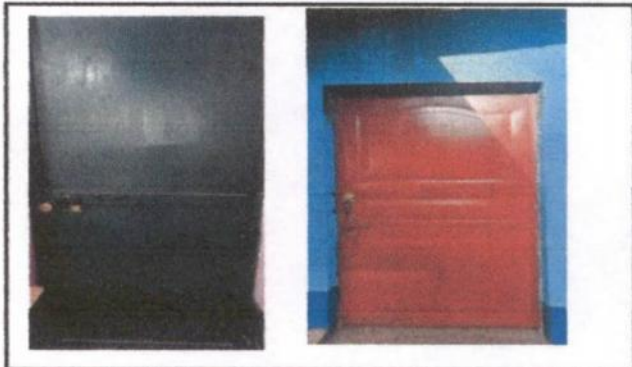
Foto 4: Sustitución de pasadores por chapas yales en dos puertas.