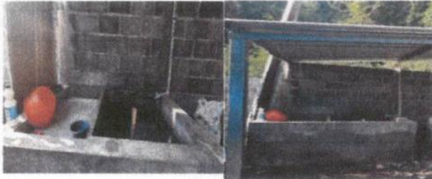
Foto 9: Sustitución de pila de concreto de largo 2m, ancho 1m, altura 1m; incluyendo accesorios. Colocación 20 ML de tubería de PVC línea principal de aguas neras y 20 ML tubería de agua potable