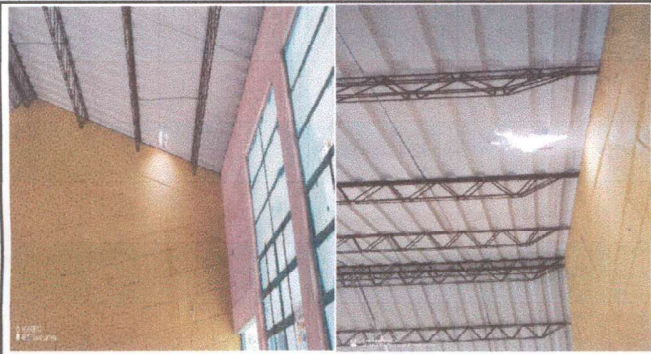
Foto1: Sustitución de techo y pintura.