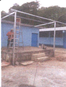
Foto 1: Instalación de estructura metálica y ampliación de laminado en área de escenario.