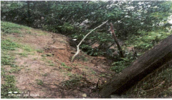
Foto1: Construcción muro perimetral