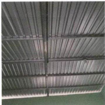
Foto1: Techo de cocina instalado.