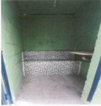
Foto1: Migitorios ya terminados.