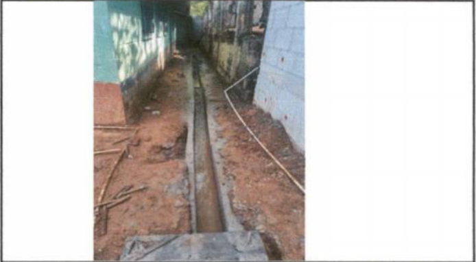
Foto 4: Reparación red de drenaje para evitar empozamiento de agua por lluvias.