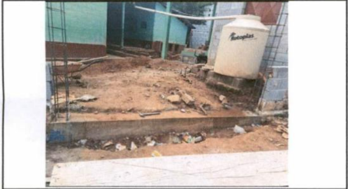
Foto 3: Reparación y extensión de muro perimetral de establecimiento.