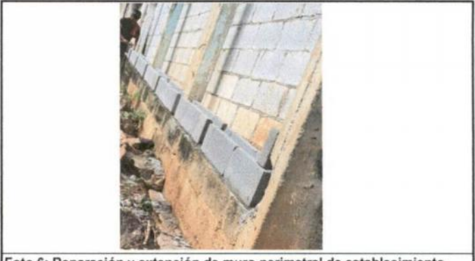
Foto 6: Reparación y extensión de muro perimetral de establecimiento.

Observación: Si es necesario se pueden agregar hojas adicionales y actualizar el número de hojas.