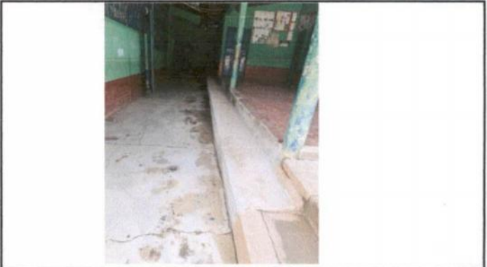
Foto 2: Mantenimiento de losa de patio, para evitar el avance de grietas en el mismo.