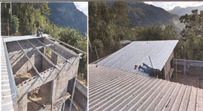
Foto 3: Anexa; Instalación de estructura de metal y cubierta de lamina