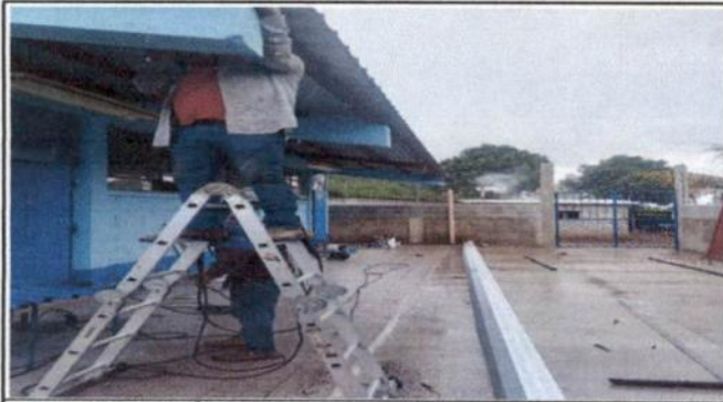
Foto1: INSTALACIÓN DE CANALES Y BAJDA DE AGUA PLUVIAL