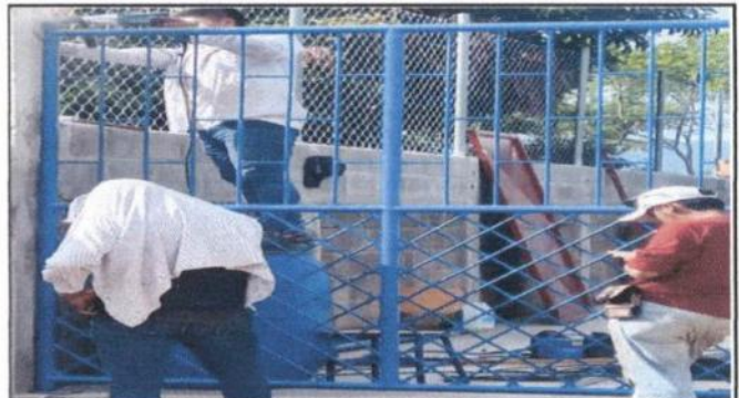
Foto 4: SUSTITUCIÓN DE PORTON