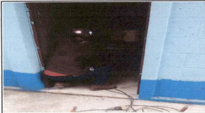
Foto1: SUSTITUCIÓN DE PUERTA