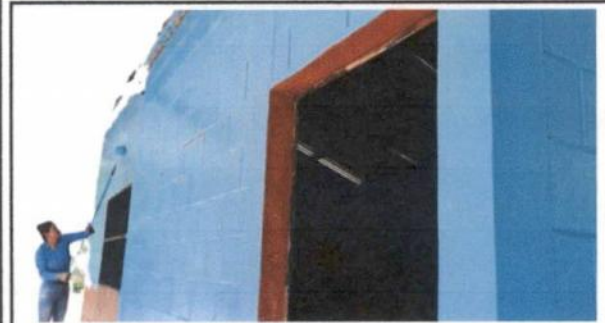
Aplicación de pintura en el establecimiento