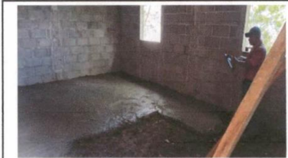
Aplicación de torta de cemento