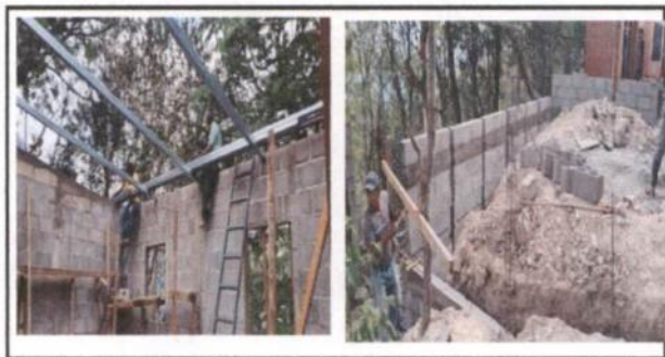
levantado de pared, aplicación de torta de cemento, sustitución de lamina acanalada por troquelada, colocación de puerta y 2 ventanas

Observación: Si es necesario se pueden agregar hojas adicionales y actualizar el número de hojas.