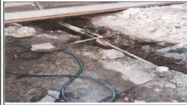
Reparación de tubería y colocación de sistema