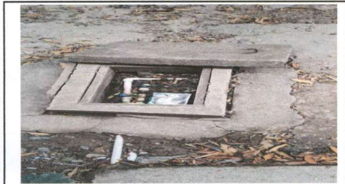
Reparación de tubería de agua potable