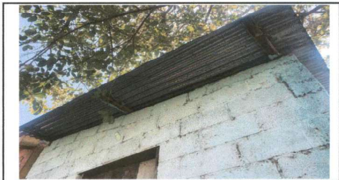
Sustitución de lamina por troquelada

Observación: Si es necesario se pueden agregar hojas adicionales y actualizar el número de hojas.