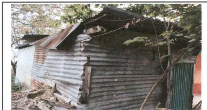
LEVANTADO DE PARED