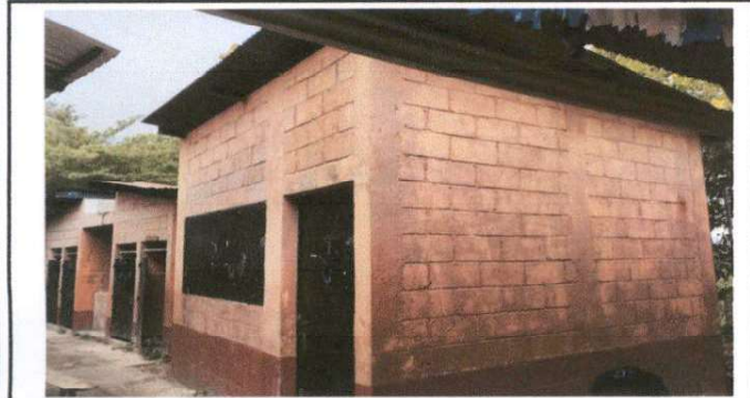
Aplicación de pintura en el establecimiento