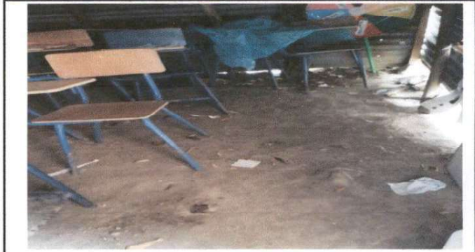
Aplicación de torta de concreto