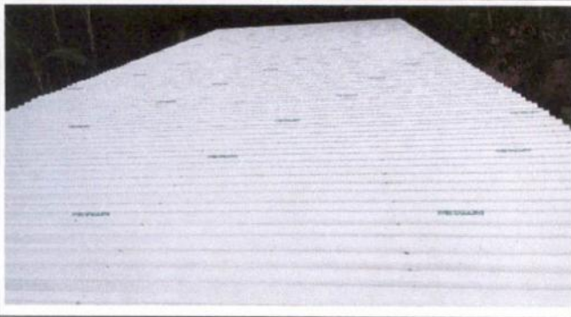
Foto1: Cubierta de lamina de aula