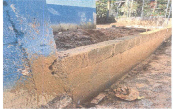
Foto2: Repair and continuation of perimeter wall