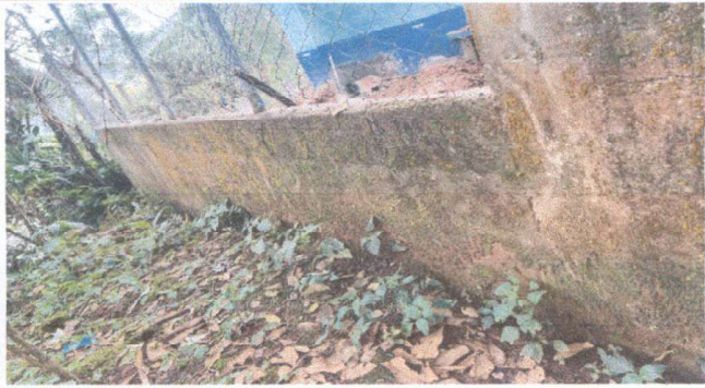
Foto1: Continuation of block wall