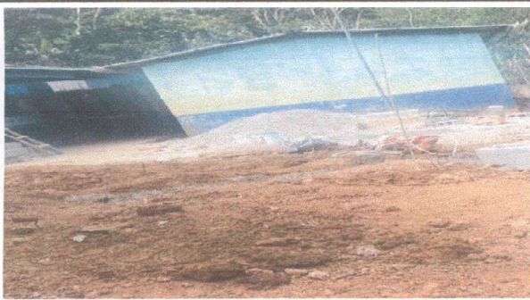
Foto5: Painting of exterior and interior walls