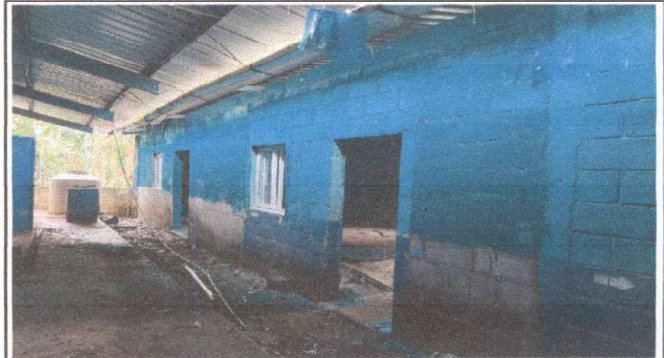
Foto4: Repair and continuation of roof tile