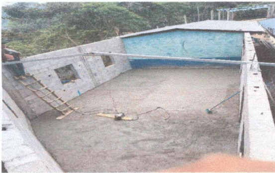
Foto3: Replacement of metal support structure